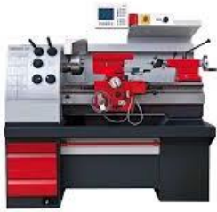
Diverse konventionellen Dreh- und Fräsmaschinen